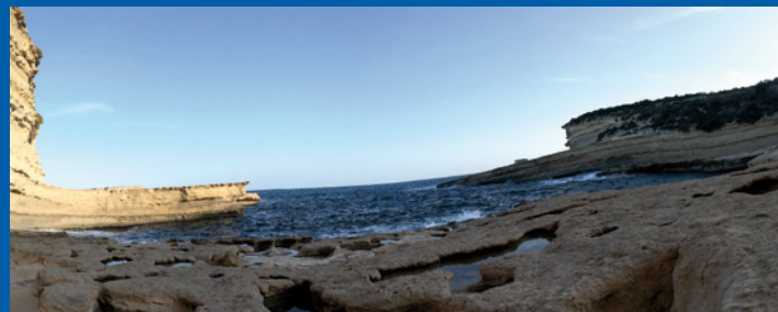
St. Peter's Pool, Malta

31 Projekte sind eingereicht worden und liegen der Jury zur Beurteilung vor. Wir danken allen Teilnehmern und freuen uns, anlässlich der Generalversammlung 2018 im Tessin die Gewinner bekannt geben zu können.