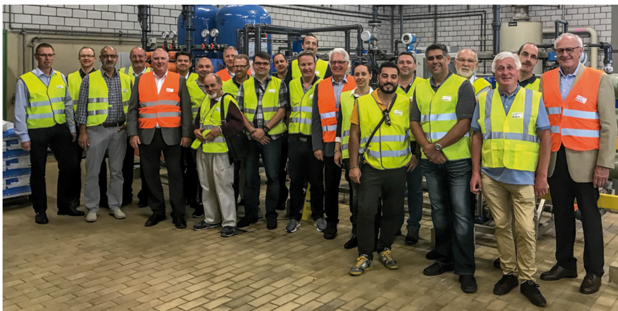
Am 8. Juni 2017 wurden unter anderem die Wasseraufbereitung, Abwasser Flotation und Hangars mit Arbeitsgeräten und Sammelstellen von SR Technics Kloten ZH besichtigt.