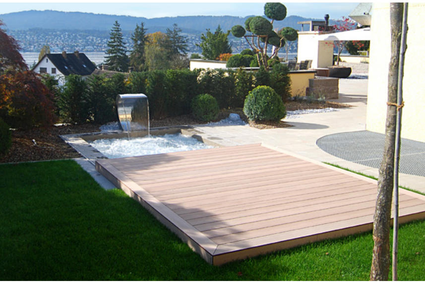
Nominiertes Projekt Woodtli Schwimmbadtechnik GmbH Beton-Whirlpool mit Wasserschwall und Schiebedeck, 4 m 2 woodtli.com