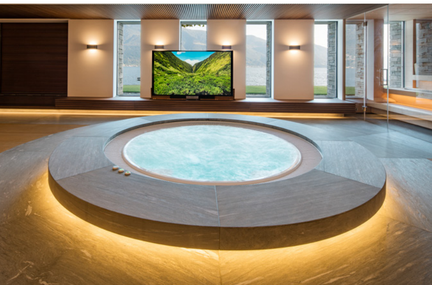
Nominiertes Projekt Vivell AG Schwimmbadtechnik Indoor-Whirlpool mit Überlaufrinne, 2.2 m 2 vivell.ch