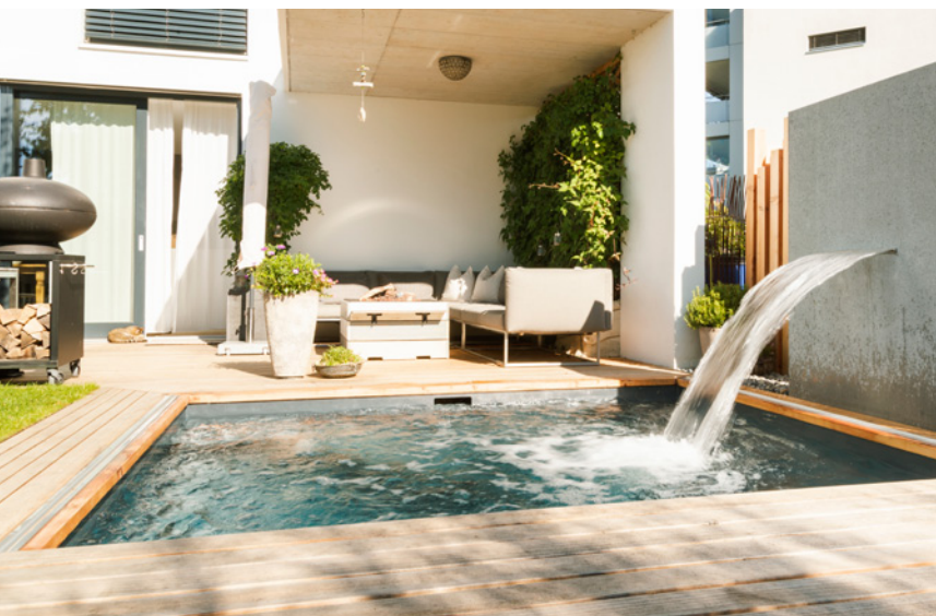
Nominiertes Projekt ZIREG Ziswilwer GmbH Polypropylen-Becken mit Wasserschwall und Holzdeck, 9 m 2 zireg.ch